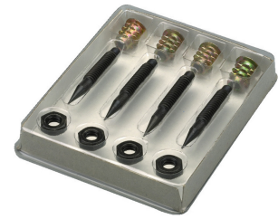
SPS-45/SW \varnothing 8,5