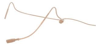
Umbau von 3-Pol-HSE-Kopfbügelmikrofonen zum Anschluss an JTS-Taschensender Reconfiguration of 3-pole HSE headband mics for the connection to JTS pocket transmitters

Durch die Nierencharakteristik sind diese Mikrofone in Hinsicht auf Rückkopplungen besonders unproblematisch!